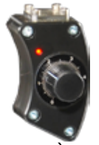
MICROMÈTRE AVEC LED