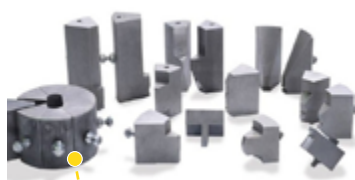
jeux de mors